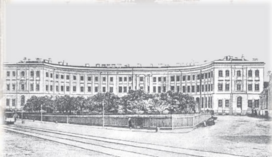
Александровский институт в Смольном

Судьба Е. И. Нелидовой, фаворитки императора Павла Петровича.